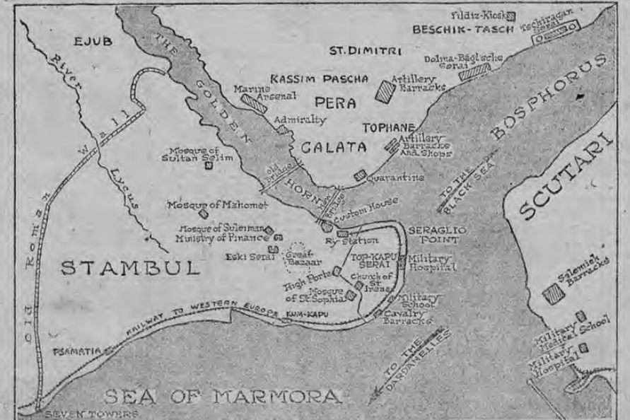
Este es un dibujo militar de la ciudad de Constantinopla el cual muestra en detalle las diversas secciones de la ciudad que están situadas a orillas del Cuerno de Oro. La parte antigua de la ciudad se conoce con el nombre de Stambul. La parte nueva de la ciudad está situada al otro lado del Cuerno de Oro. Una parte de la ciudad está situada sobre el lado asiático del Bósforo. Este dibujo militar es de sumo interés en estos momentos en que los aliados se están abriendo paso a través de los Dardanelos con el objeto de capturar la ciudad capital. Al mismo tiempo que este sucede en los Dardanelos, los turcos huyen desfavoridos hacia la porción asiática de Turquía a donde han trasladado ya la capital.