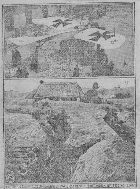
El grabado superior muestra un aeroplano de guerra alemana tipo "Taube", que fue tumbado mientras volaba sobre París y que actualmente se exhibe en una de las calles de esa ciudad. En el grabado se ven algunos soldados convalescientes que le examinan y que escriben sus nombres sobre su superficie. El grabado inferior muestra a los soldados franceses en sus laberintos de trincheras y da una magnífica idea de cómo se comunican éstas.